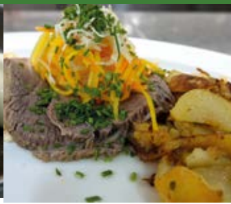
Originalfotos aus Speisesaal und Küche